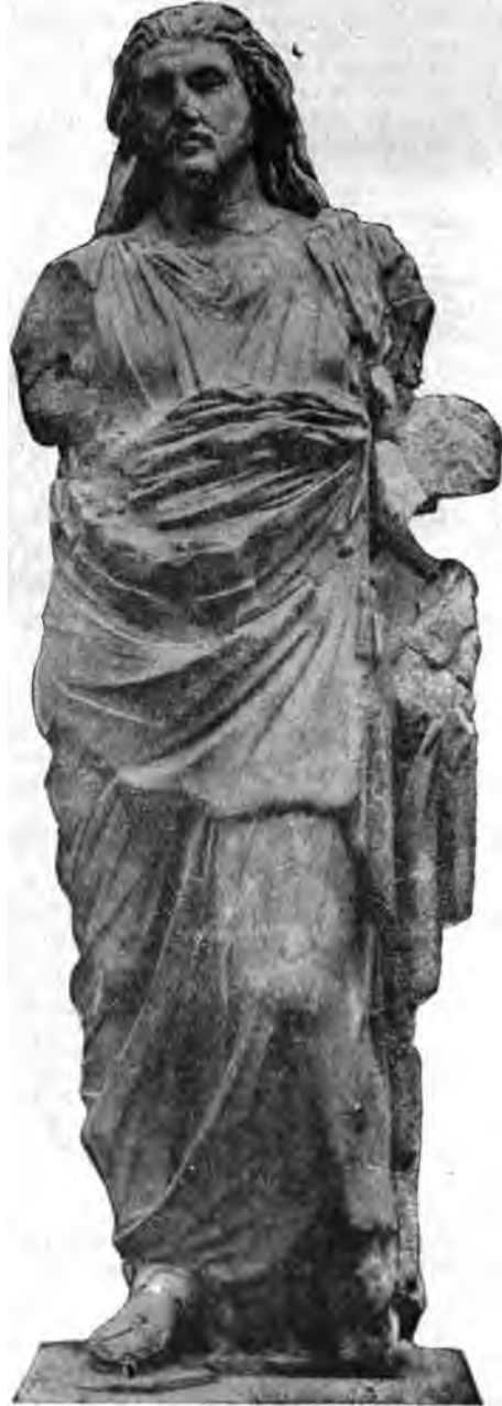
Platte der Abbildungen.

Die inzwischen erschienenen Lieferungen 2 und 3 behandelnden auf dem Humus der alten Culturen triebkräftig emporwachsenden „Archaismus“ der griechischen Plastik. Die Vorzüge, denen diese Epoche selber ihren Reiz verdankt: das Organische Durchsichtige, Strebsame der Entwicklung, den Einsatz besten Könnens, frische und liebevolle Behandlung des Einzelnen möchte man auch vorliegender Darstellung derselben nachrühmen. Auf aussergewöhnlich guter Höhe halten sich auch die Abbildungen . . .